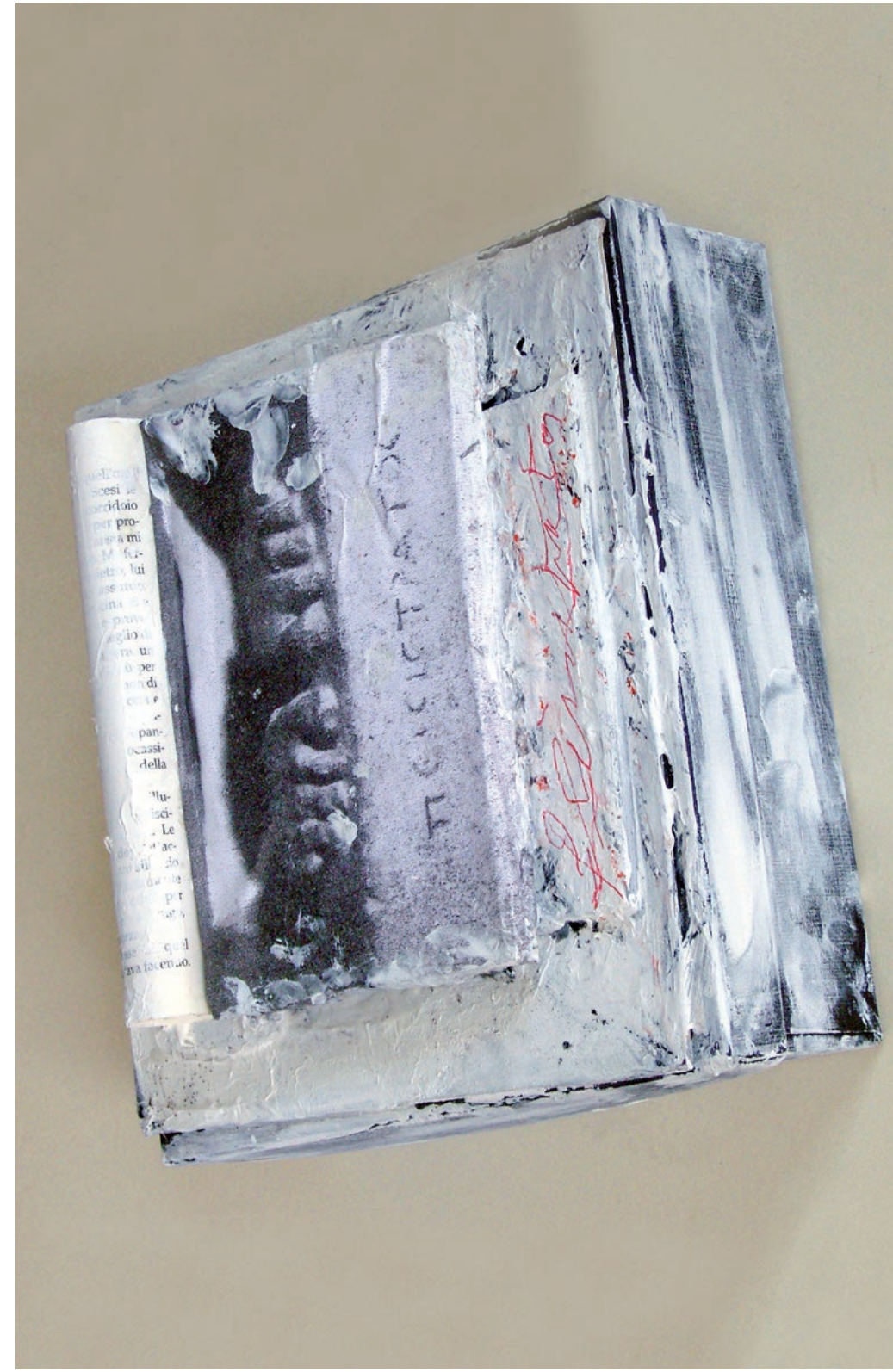
senza titolo, 2010 - tecnica mista - 21x21x11 cm.