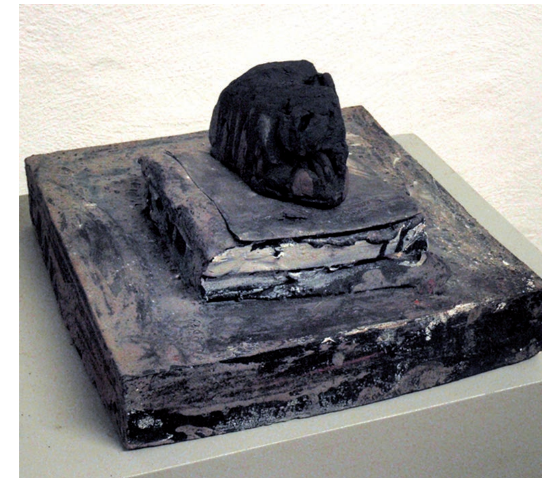
senza titolo, 2009-2010 - ceramica dipinta - 28x28x18 cm.