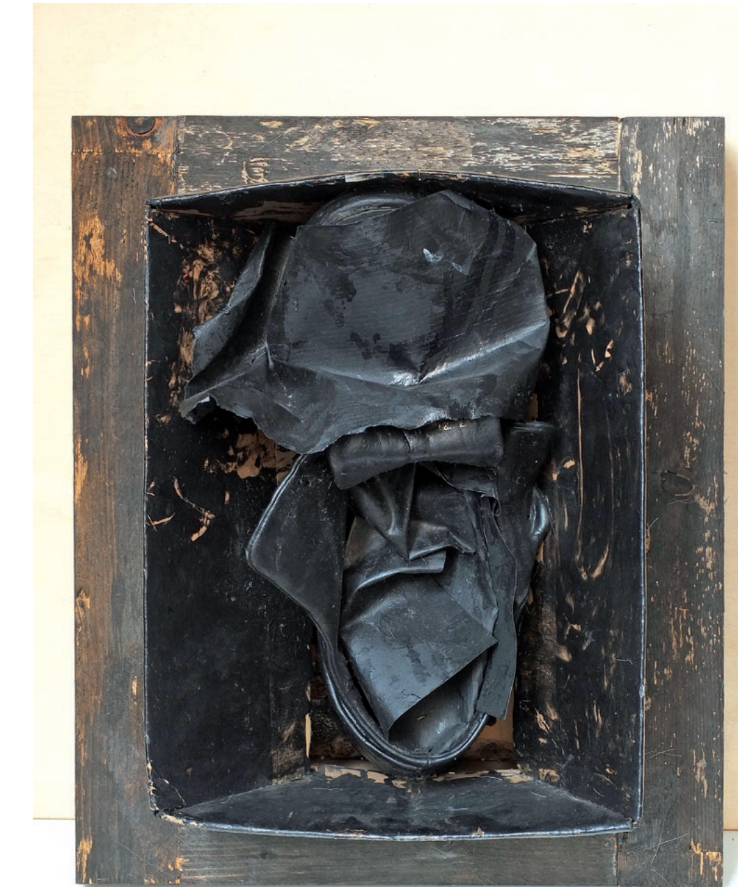
senza titolo, 2012 - legno, cuoio e cartone - 39x33x20 cm.