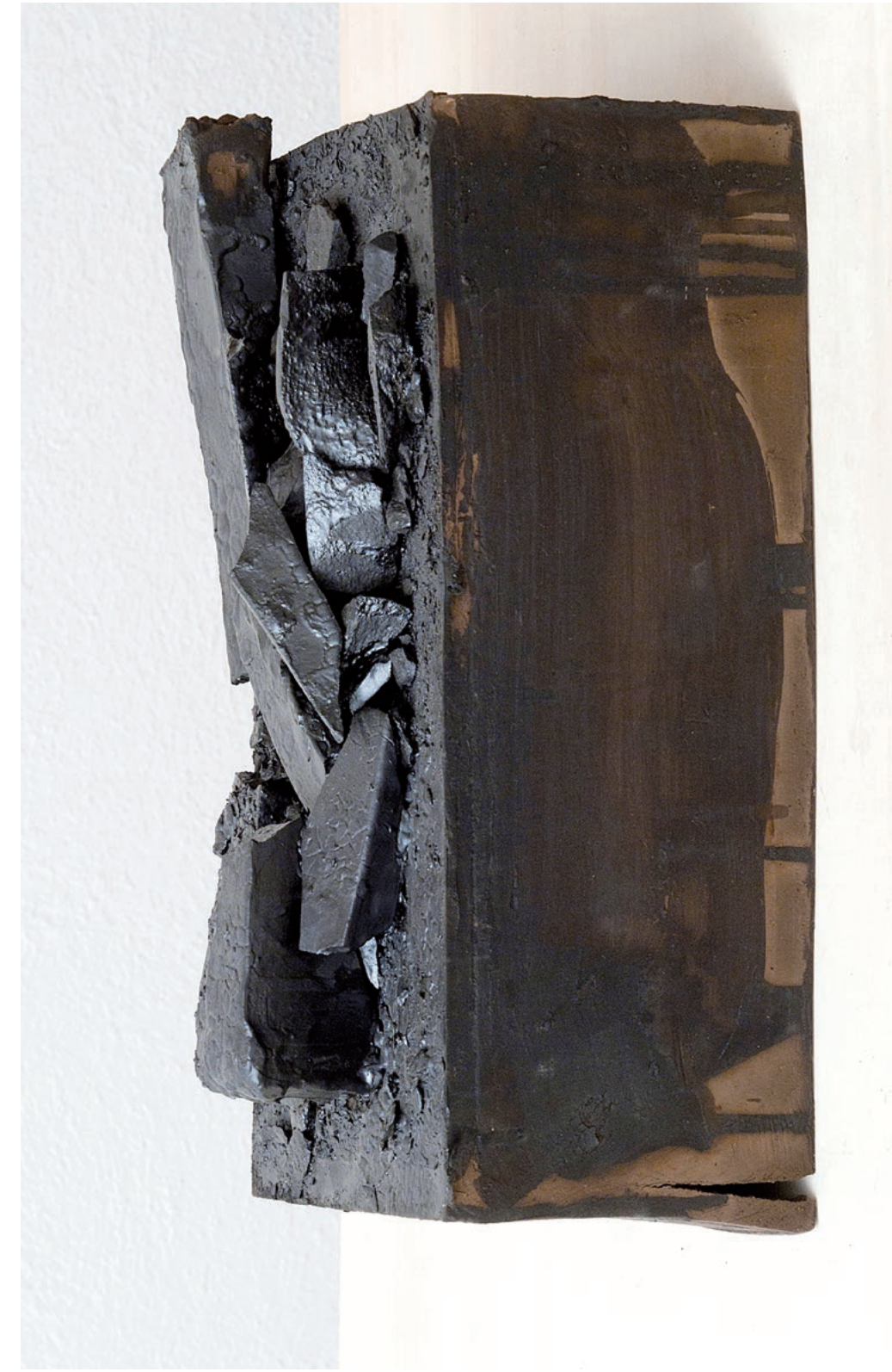
senza titolo, 2011 - ceramica - 37x18x15 cm.