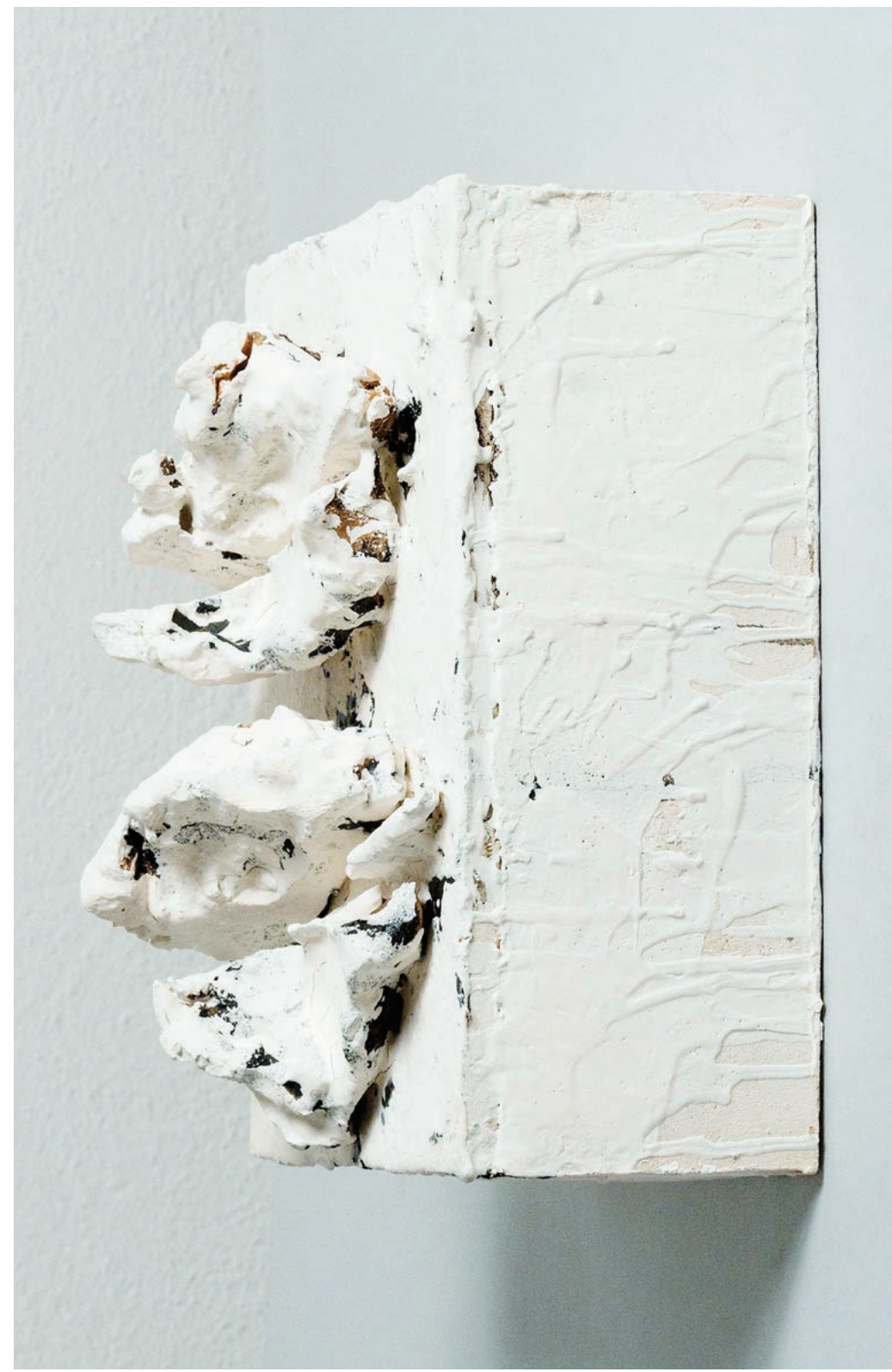
senza titolo, 2011 - ceramica - 27x19x8 cm.