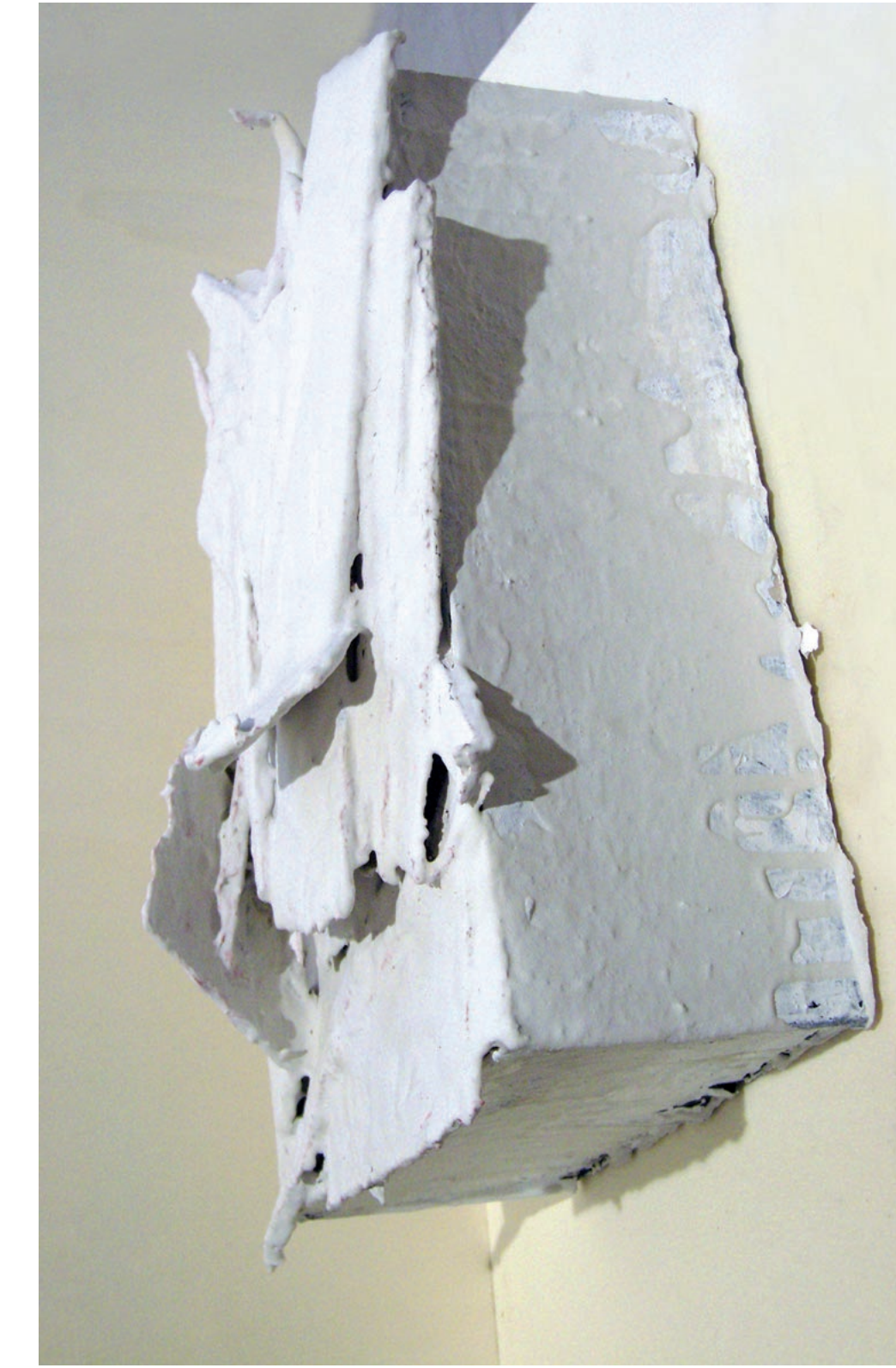
senza titolo, 2010 - cartone, legno e caolino - 18x31x75 cm.