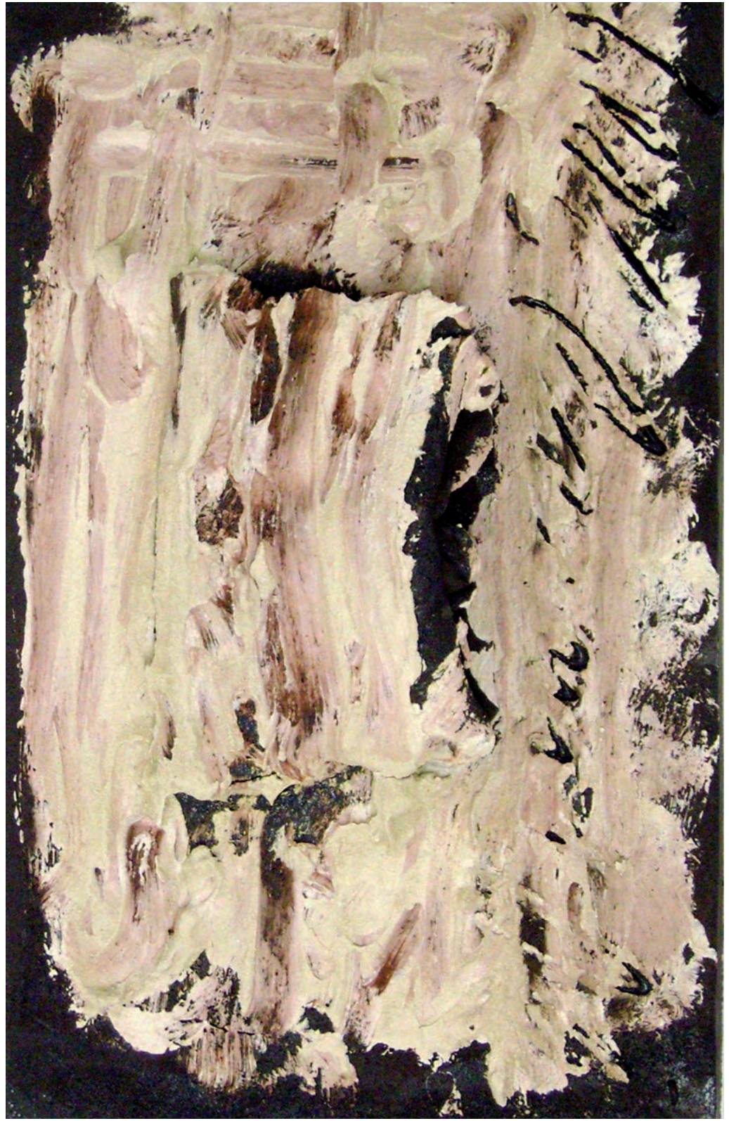
senza titolo, 2009 - ceramica - 32x21x6 cm.