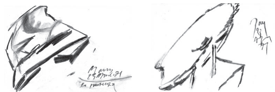
senza titolo, 1971 - carboncino su carta - 24x34 cm. (ciascuno)